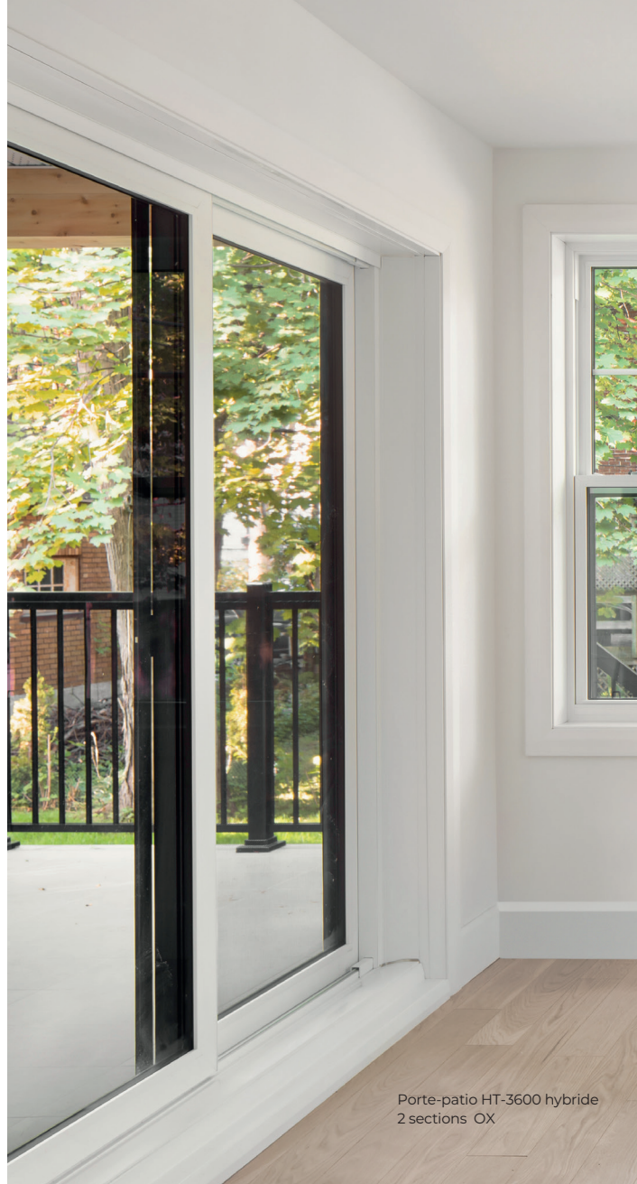
Porte-patio HT-3600 hybride 2 sections OX

Sa conception et fabrication à 100% par l'entreprise permet un contrôle absolu de qualité.