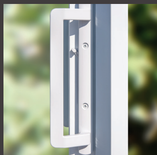
Barrure double à mortaise