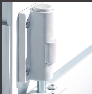
Barrure au pied en option